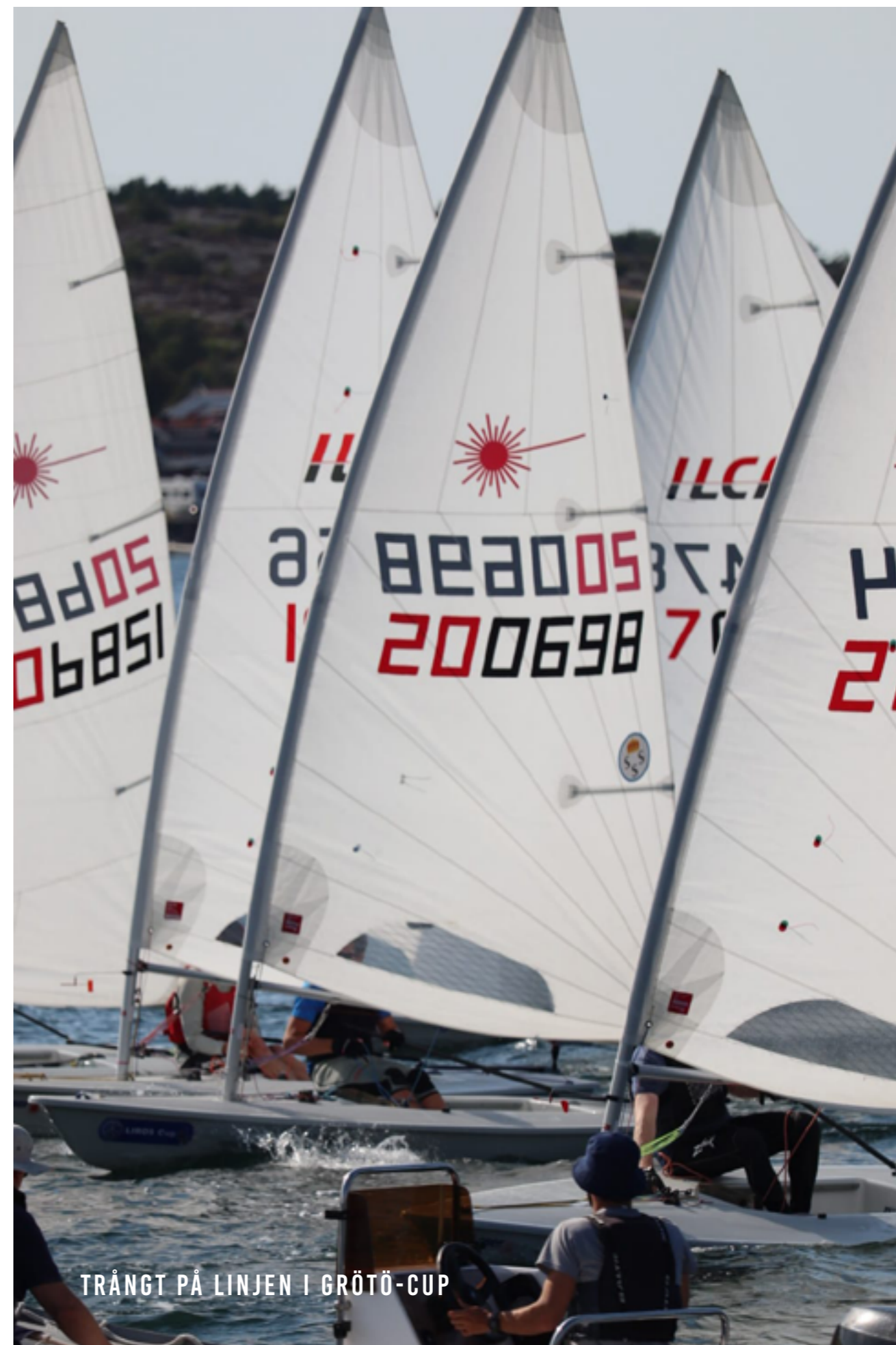
TRÅNGT PÅ LINJEN I GRÖTÖ-CUP