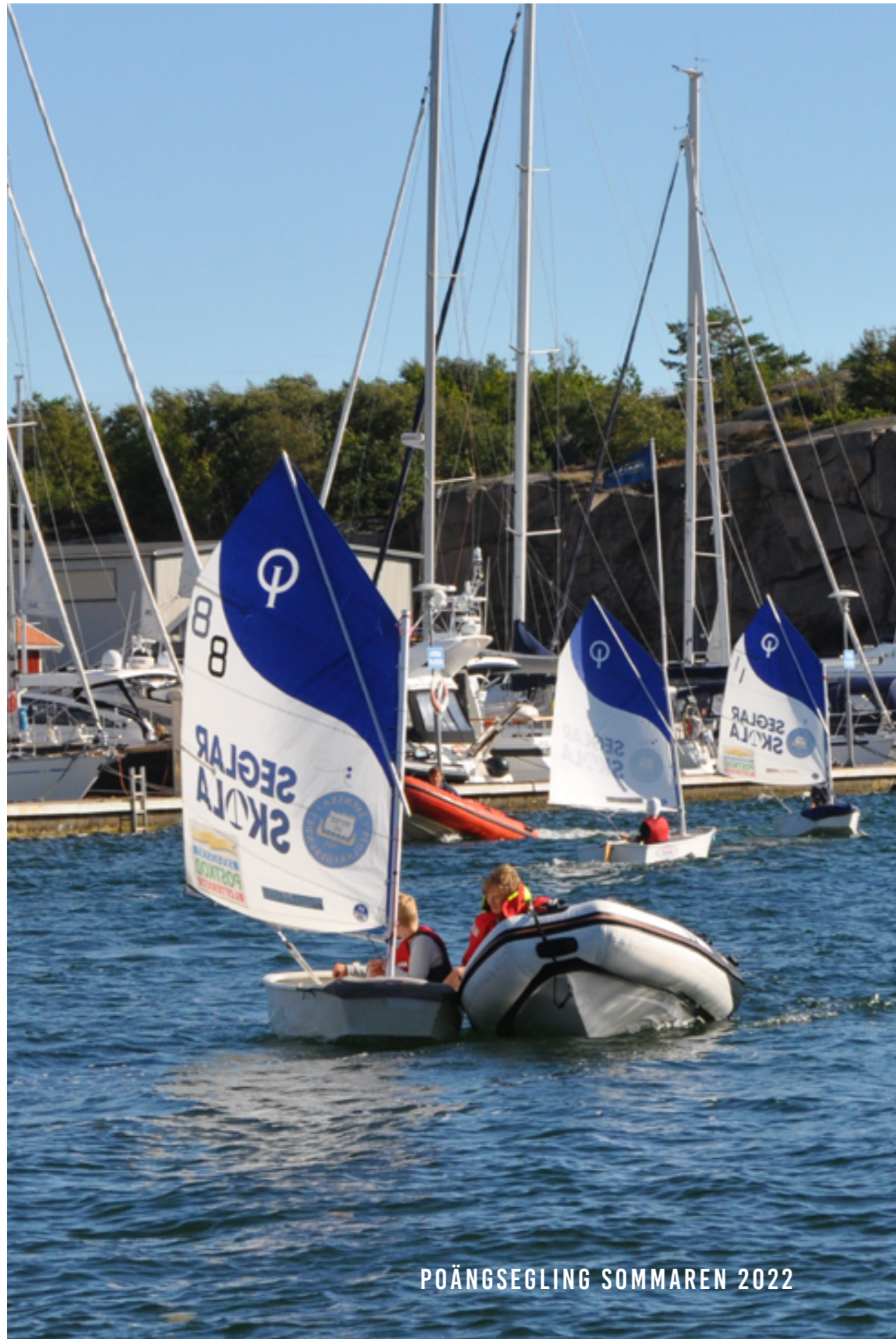
POÄNGSEGLING SOMMAREN 2022