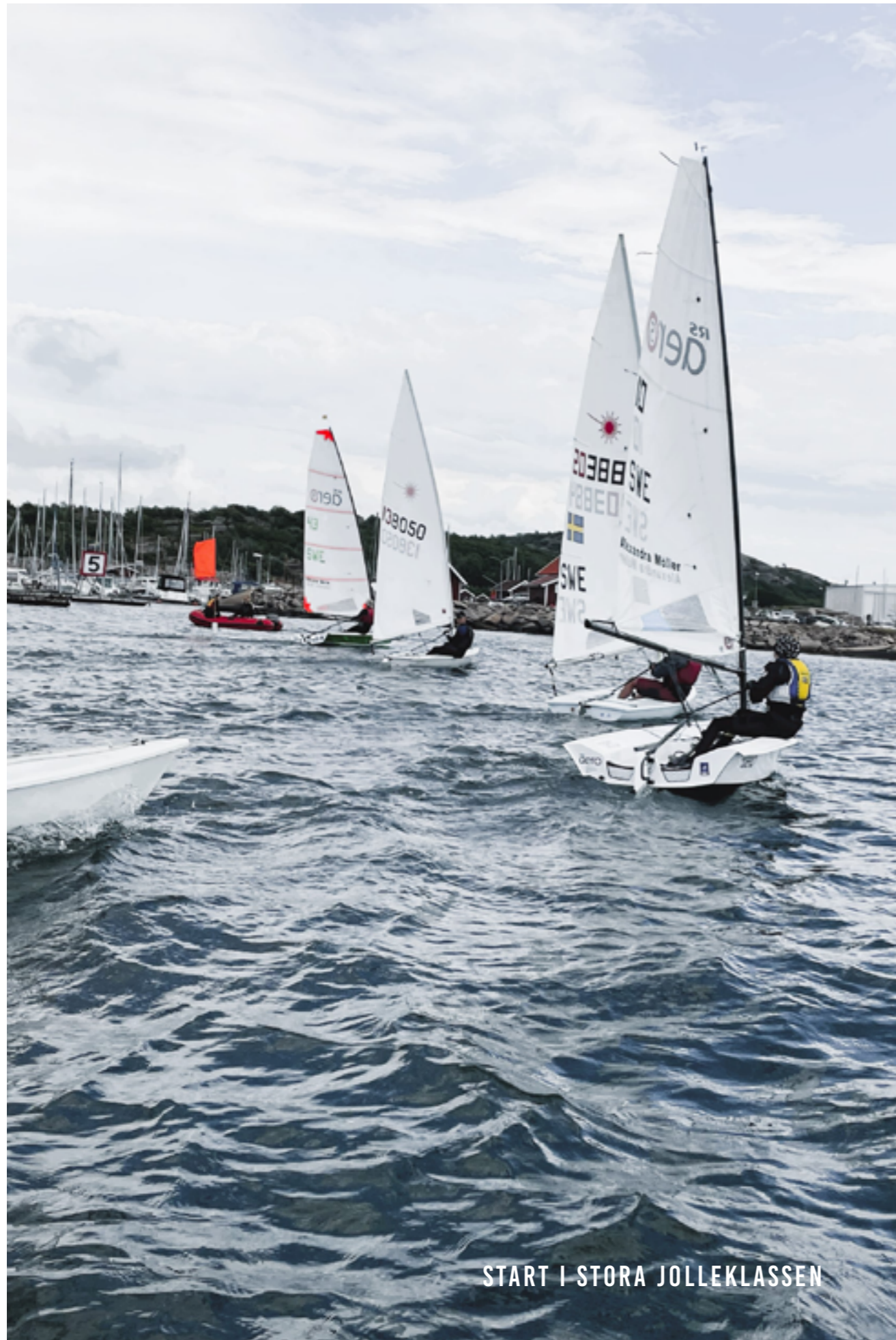
START I STORA JOLLEKLASSEN